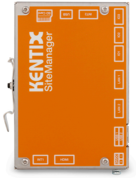
Seitenansicht mit Beschriftung aller Anschlüsse und Ports